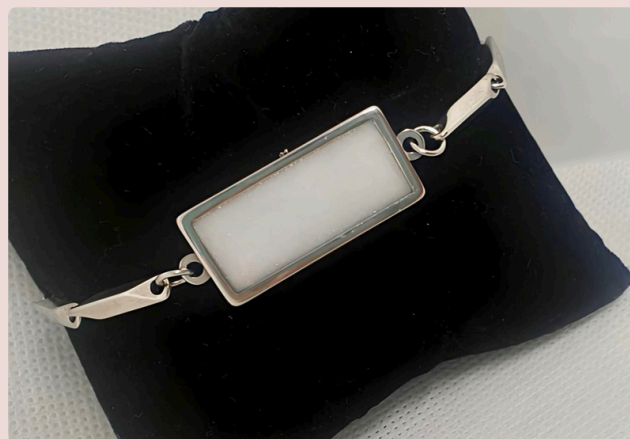
BRACCIALE UOMO TARGHETTA

TRASFORMA IL TUO LATTE IN QUALCOSA VERAMENTE UNICO E MAGICO.