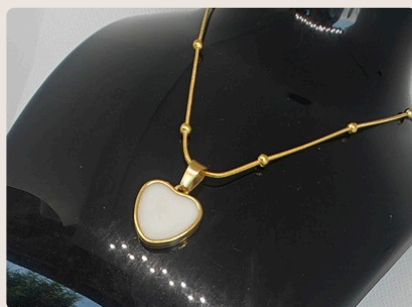
GOLDEN LOVE DOUBLE