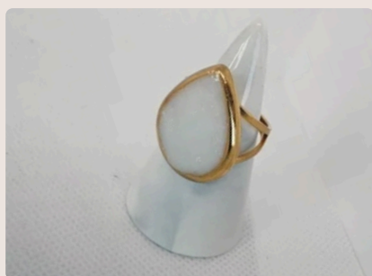
GOCCIA DI LATTE GRANDE

Tutti i gioielli sono disponibili nel mio negozio online