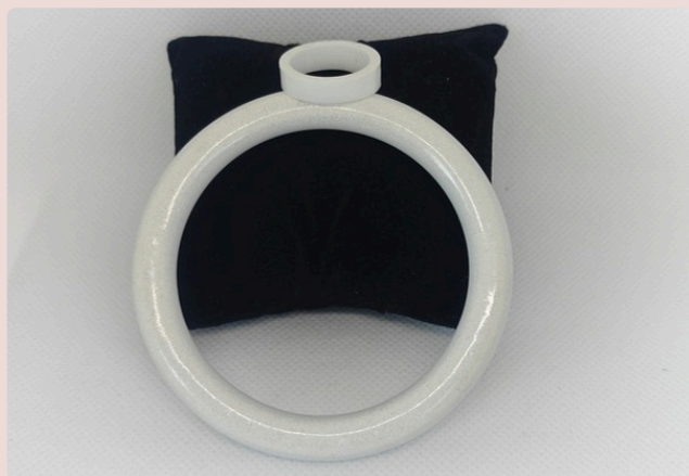
SET IN LATTE