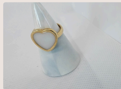
LOVE HEART GOLD

Vieni a vedere tutte le mie creazioni sul mio shop