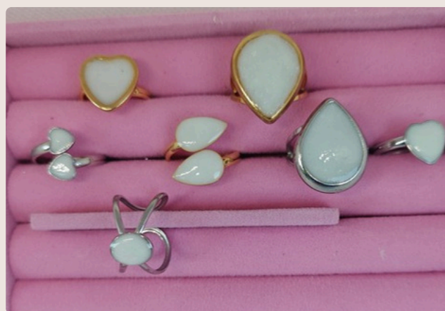
SELEZIONE DI ANELLI